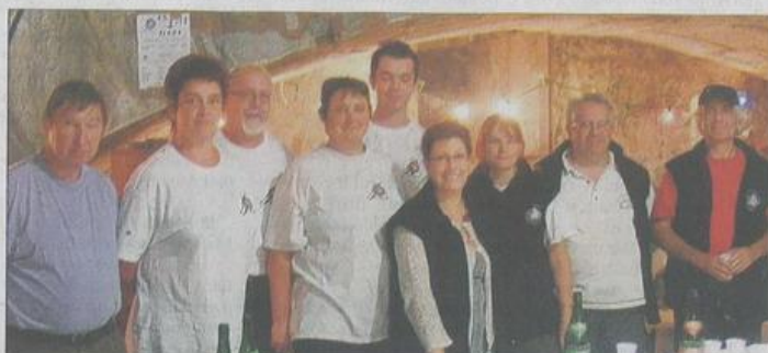
Les bénévoles de l'association étaient mobilisés toute la journée pour assurer le bon déroulement de ce concours 3D qui a réuni 125 participants.

D imanche, la 1 ère Compagnie de tir à l'arc de Pontcharra a organisé la troisième édition de son concours de tir 3D sur le site du Fort Barraux.