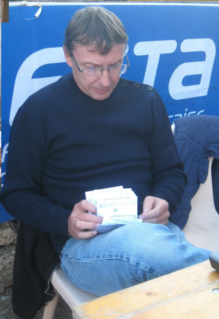
En attendant les résultats : un petit tour vers la buvette !